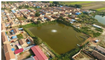
村庄紫色坑塘治理前后

我们发现，这类环境污染现场往往不好找，但更难的是，找到随意偷排的污染源。有些加工制造小厂的生产设施简易，只需要在郊外的隐蔽处搭个棚、几台设备就可以开始生产，因此也更容易转移；哪怕周边存在相关的工业聚集区，由于没有监控，也较难取证。更何况，有的环境污染点是属于“遗留”污染问题，直接排污的加工厂已经关停了。