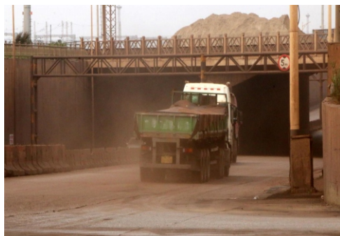
港口运输道路扬尘污染，已整改

通过对港口道路的空气质量监测和港口积尘成分检测，我们发现港口扬尘还包含多种有害重金属等物质，可能会对人体是呼吸道、心脑血管健康造成影响。