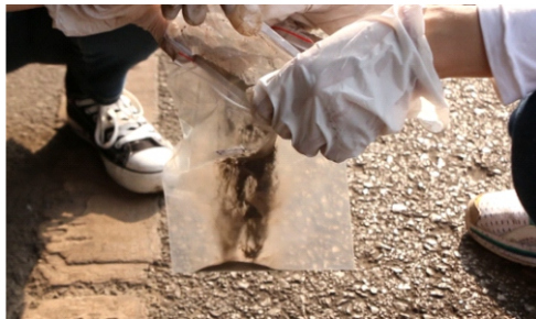
采集港口运输道路积尘进行专业检测