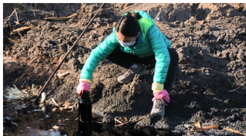
绿领成员在环境现场采集水样

2020年，随着爆发的疫情得到控制，绿领环保逐步调研了天津市、河北省14个县（区）的60个环境污染点，并走访了纸塑分离加工、铸造业等13种不同类型的工业聚集区。